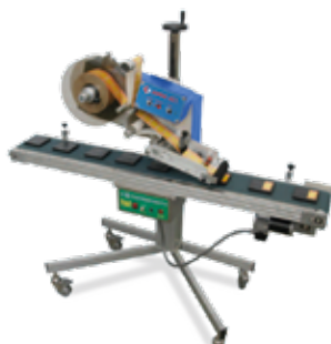
Etichette su cofanetti