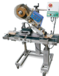
Sistema Top vaschette